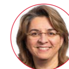
Amina Chouiter Djebaili députée

Les avantages d'une telle inscription sont nombreux. Pour les personnes âgées, cela signifie une meilleure reconnaissance de leur rôle dans la société et une protection renforcée de leurs droits. Le vieillissement n'est pas un phénomène temporaire, mais une évolution structurelle qui nécessite une vision à long terme. Inscrire les droits des aîné-es dans la Constitution permet de poser les bases d'une société plus inclusive, plus équitable et plus solidaire. Reconnaître la place des aîné-es, c'est reconnaître leur contribution passée, leur rôle présent et leur importance pour l'avenir. C'est affirmer notre volonté de construire une société qui respecte chaque individu et valorise toutes les générations.